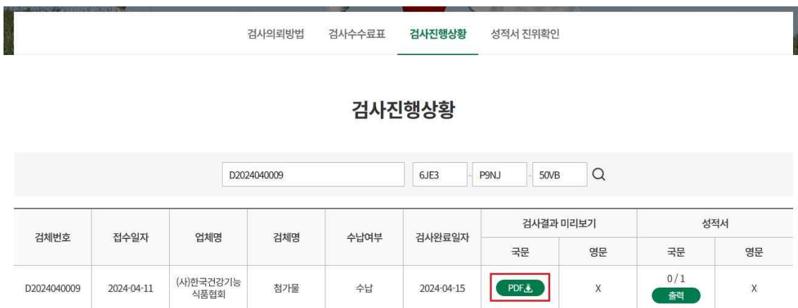
▲ 검사결과 미리보기 예시 화면